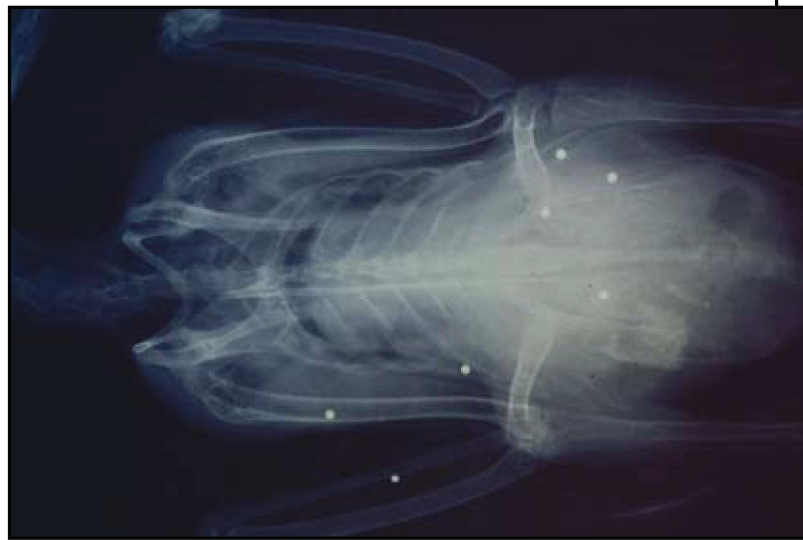
Abb4: Brandgans von Wasservogeljäger an der Ems erlegt, Röntgenfoto.

Die Arbeitsgemeinschaft Naturnahe Jagd Norddeutschland e. V. hatte daher in einem Positionspapier bereits 1996 zur Jagd in Schutzgebieten deutlich wirksame Einschränkungen gefordert. Danach sei die Jagd auf Vögel dort grundsätzlich zu verbieten. Sie hat sich dem Naturschutz unterzuordnen und eine dienende Funktion einzunehmen, wie es das Bundesjagdgesetz in seiner Naturschutzfunktion verlangt.