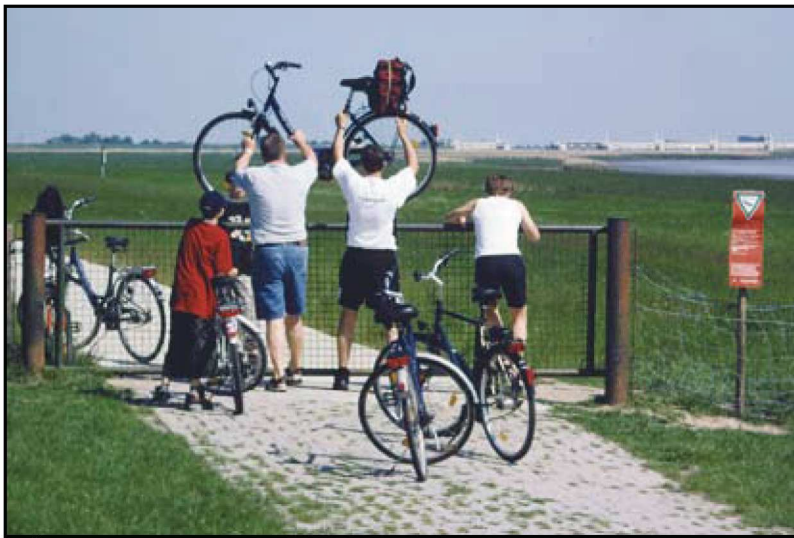
Abb3: Naturschutzrealität im NSG Petkumer Deichvorland, im Hintergrund das Emssperrwerk in Gandersum.

Darüber hinaus hatten selbst zwei unabhängig voneinander bemühte Gutachter eindeutig die ganzjährige Öffnung des Teek-Abfuhrweges als unverträglich strikt abgelehnt. Das hinderte die Stadt Emden als zuständige Kommune nicht, noch ein drittes Gutachten zum Preise von 150.000 Euro zu bestellen in der Hoffnung, das störungsintensive Betreten des Weges zu rechtfertigen.